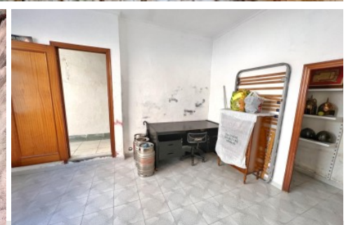
Casa en Petrer, Casco antiguo