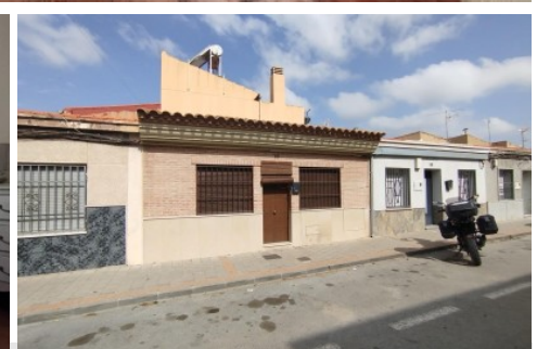
Casa en Petrer, Salinetas