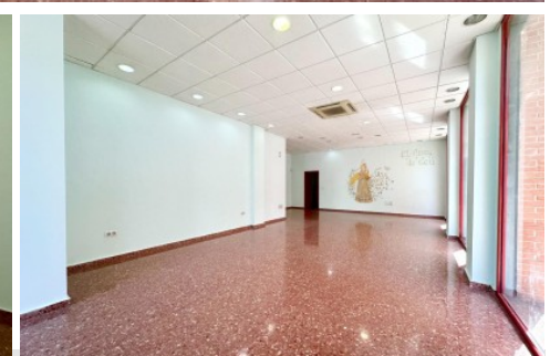
Local comercial en Petrer, El Campet