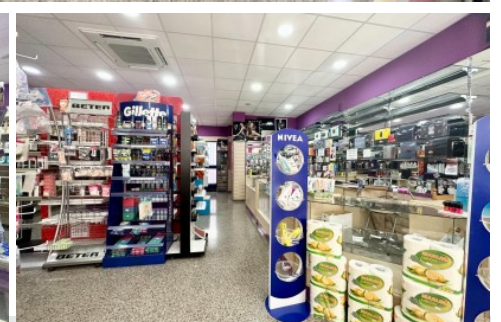
Local comercial en Petrer, El Campet