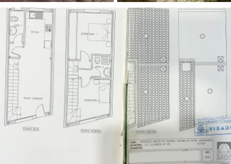
Solar en Petrer, Casco antiguo