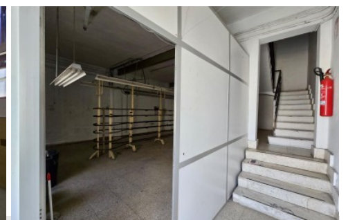
Nave industrial en Petrer, Barrio San Rafael