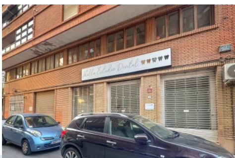
Local comercial en Elda, Plaza Castelar - Mercado Central