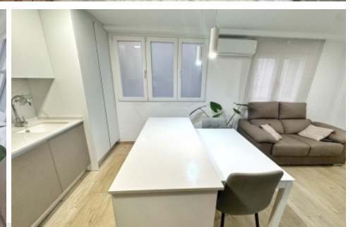
Piso en Elda, Avd. Olimpiadas